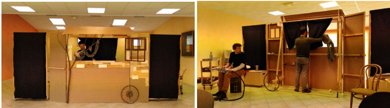
Vue face décor et vue de l'envers du décor (en cours de construction)

- Le décor se compose d'un castelet et de deux panneaux noirs, le tout sur roulettes, chaise, instruments de musique, 2 marionnettes, accessoires divers. (photos : décor en cours de construction). Le décor est traité avec une solution ignifuge.